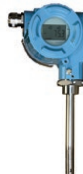
MMY 31 トランスミッタ