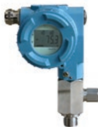
MMY 30 トランスミッタ