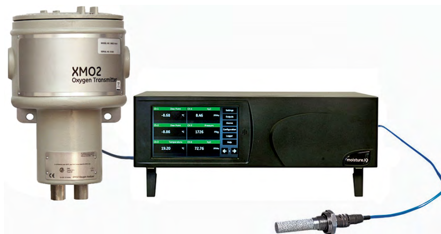
Der XMO2-Ausgang kann als Eingang für Analysatoren der Panametrics Moisture Serie verwendet werden, um Feuchte und Sauerstoffgehalt gleichzeitig zu messen und anzuzeigen