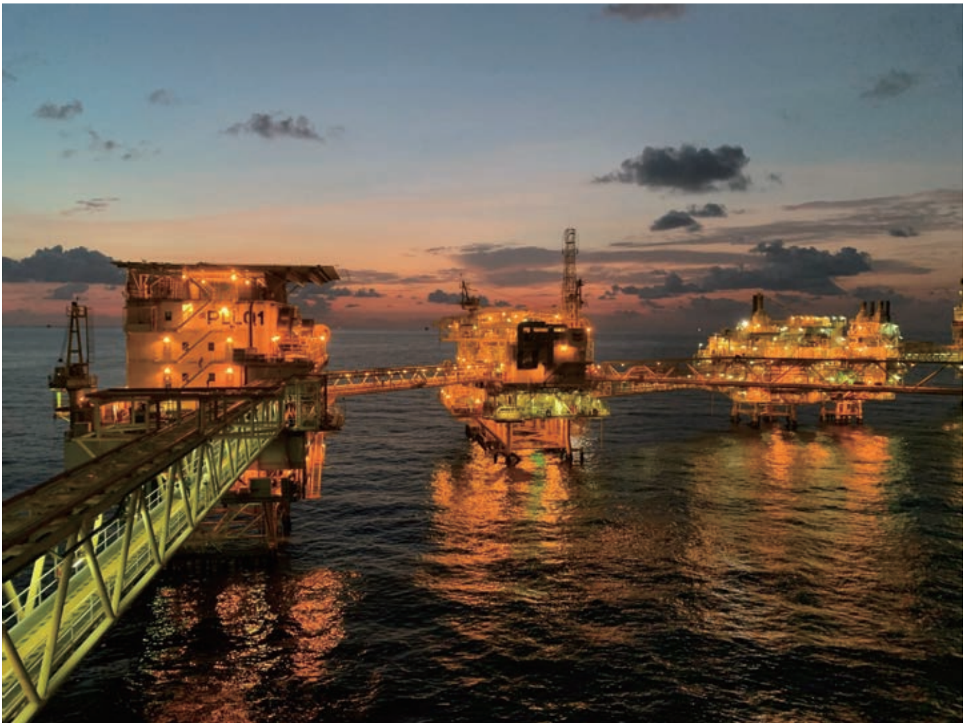
태국만 해상 압력 용기 검사