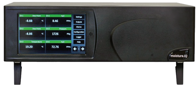
Bench Mount Version

Der moisture.IQ kann über seine Eingänge mit den Panametrics MIS- und den M-Serie Sensoren verbunden werden, welche auch für die Moisture Image Series und Moisture Monitor Series 3 Analysatoren verfügbar waren. MIS Sensoren (MISP und MISP2) ermöglichen die integrierte Messung von Feuchte, Temperatur und Druck. Die Kalibrierdaten dieser Sensoren sind digital gespeichert. Sobald der Sensor mit dem Analysator verbunden wird, werden die Kalibrierdaten zum moisture.IQ heruntergeladen.