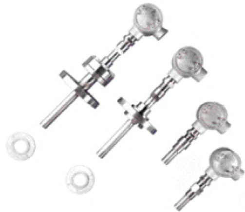
Bundle Waveguide Technology™-System

Während die Ultraschall-Durchflussmesser der meisten Hersteller sich nur für Temperaturen bis 260^{\circ}\text{C} eignen, können Sie die BWT-Systeme von Panametrics für Temperaturen bis zu 537^{\circ}\text{C} einsetzen. Durch die einzigartige Auslegung wird das piezoelektrische Element mithilfe von Wellenleitertechnologie außerhalb des Hochtemperaturbereichs platziert. Der Messwandler kann sogar im Betrieb ausgetauscht werden. Ein Kunde tauschte seine vorhandenen Blenden-Messgeräte durch 16 Ultraschall-Durchflussmesser aus und betrieb diese mehr als fünf Jahre vollständig wartungsfrei.