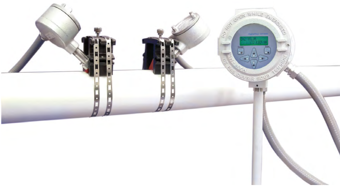
DigitalFlow XMT868i mit Aufspann-Messwandlern